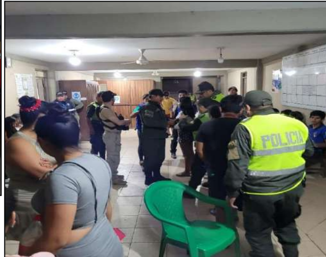
OPERATIVO EN FECHA 26/08/2022: “A los Centros de Expendio de Bebidas Alcohólicas”.