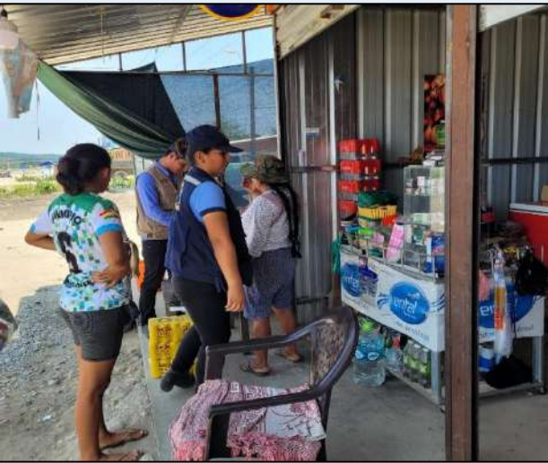
OPERATIVO EN FECHA 11/11/2022: “Control de productos de contrabando y vencidos”.