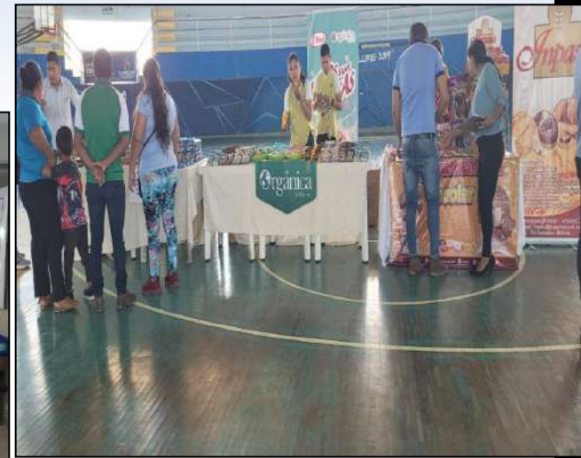
INSPECCIÓN EN FECHA 23/11/2022: “A la presentación de productos alimenticios para el servicio de desayuno escolar a nuestro Municipio”.